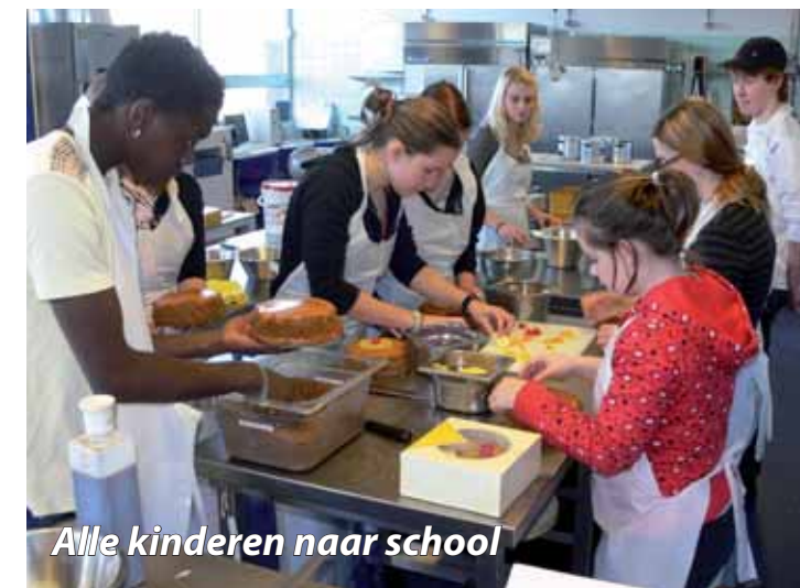
Alle kinderen naar school

Holland Rijnland-gemeenten werken ook samen bij de uitvoering van de volwasseneneducatie en de invoering van het participatiebudget.