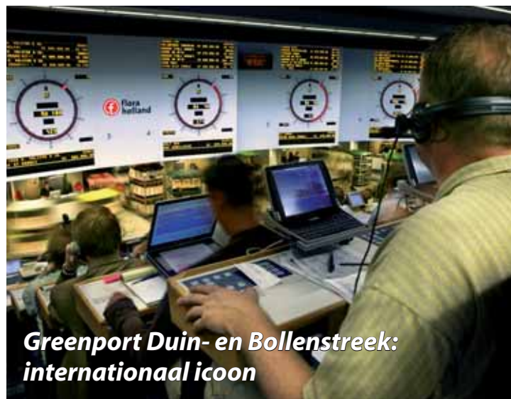
Greenport Duin- en Bollenstreek: internationaal icoon

Plassengebied en maakt het toegankelijk. Duin, Horst en Weide is een bufferzone in het stedelijk gebied van de Randstad die verder wordt versterkt.