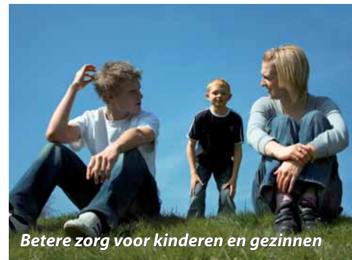
Betere zorg voor kinderen en gezinnen