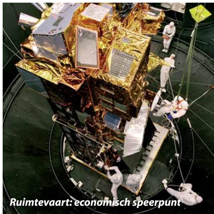
Ruimtevaart: economisch speerpunt