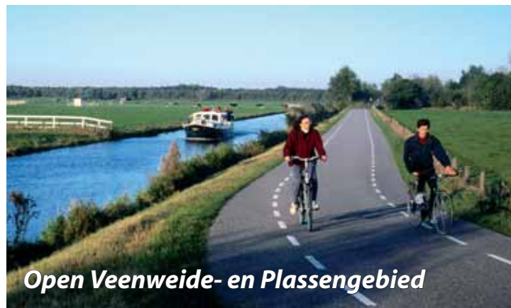
Open Veenweide- en Plassengebied

via Alphen aan den Rijn en Leiden verbindt met de kust bij Katwijk en Noordwijk. De lijn is essentieel voor de ontsluiting van Valkenburg.