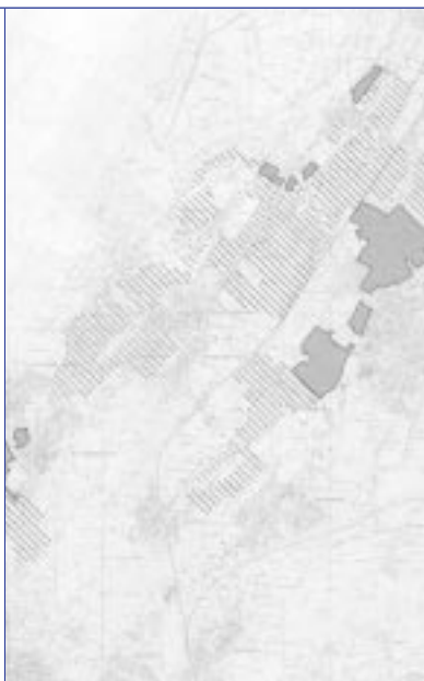
In de grijs omrande vrijwaringszones mag geen glasteelt komen.