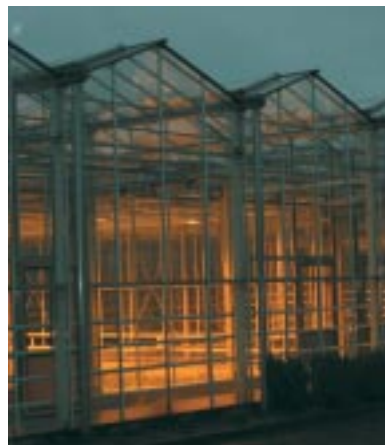
De glastuinbouw heeft een essentiële plaats in het totale sierteeltcomplex in de Duin- en Bollenstreek.