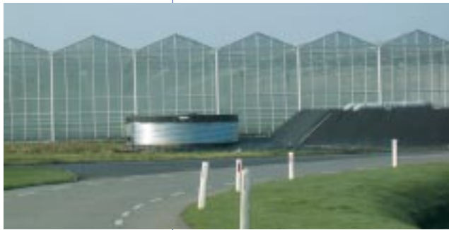
Gespecialiseerd glas In het gebied rond Rijnsburg en Valkenburg zijn veel gespecialiseerde glastuinbouwbedrijven.

Uit al die nota's blijkt dat de meeste glastuinbouwbedrijven in de streek behoefte hebben aan uitbreiding en schaalvergroting om levensvatbaar te blijven, zeker in een teruglopende economie. De gemengde bedrijven kunnen echter niet zomaar naar een glasoncentratiegebied verplaatst worden, vanwege de gebondenheid aan de volle grond. Het is ook niet zomaar mogelijk bedrijven samen te voegen en de glasruimte te benutten van bedrijven die stoppen,