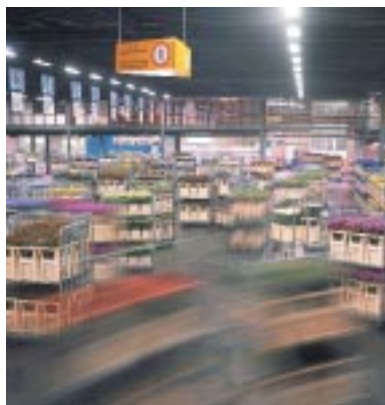
Veiling FloraHolland in Rijnsburg is het centrum van het sierteeltcomplex.

Greenport Duin- en Bollenstreek bestaat uit veredelings- en vermeerderingsbedrijven, telers, kwekers, veilingen, afzetorganisaties, groothandel, onderwijs- en onderzoeksinstituten en dienstverleners op velerlei gebied. Deze onderdelen onderhouden nauwe contacten.