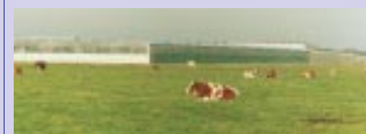
lees verder op pagina 8