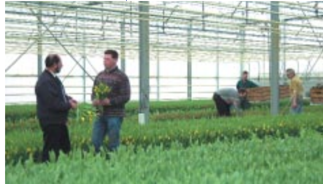
Kwekers, veredelaars, handelaars en de veiling zijn sterk op elkaar aangewezen.

handelsbedrijven zijn goed voor 700 miljoen euro omzet. De veilingaanvoer komt uit de streek, maar ook uit andere delen van Neder-