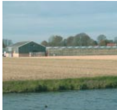
Kas in bollengebied In het noorden van de Bollenstreek komen vooral gemengde bedrijven voor, die zowel onder glas als in de volle grond telen.

daardoor eerder afneemt dan toeneemt. Aan de andere kant kunnen die ontwikkelingen als katalysator werken en kansen bieden.