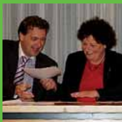
Ondertekening convenant zorg op 27 oktober 2009

De zorg voor jongeren en gezinnen is in 2009 flink verbeterd. In het kader van het regionale project Ketenaanpak Jeugd hebben diverse zorgverlenende instellingen de methode 'Eén gezin, één plan' ingevoerd. Zorgverleners van verschillende instanties maken hierbij samen één hulpverleningsplan voor een gezin. De gemeenten in Holland Rijnland en de Rijnstreek hebben in dit verband ook afspraken gemaakt met de zorginstellingen over de coördinatie van zorg en het gebruik van doorzettingsmacht als de zorg stagneert.